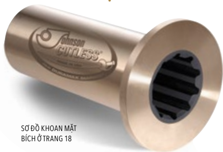
SƠ ĐỒ KHOAN MẶT BÍCH Ở TRANG 18

Các Ổ Bích Johnson Cutless® được đúc lý tâm bằng đồng thau hải quân, với mặt bích tích hợp sẵn bắt bu lông vào ống đuôi tàu hoặc vỏ bọc thanh chống nhằm giữ chặt ổ đỡ và tránh tự quay trong hộp. Lớp cao su lưu hóa chống dầu và hóa chất với công thức đặc biệt được gắn chặt vào lớp vỏ. Lớp vỏ được gia cố thành nhằm tăng sức bền cấu trúc và có thể xoay theo nấc nếu muốn. Các mặt bích đều KHÔNG-KHOAN ĐƯỢC trừ khi có chỉ định trước. Xem Sơ Đồ Khoan tại trang 18. Đối với Loại Tách Rời và Có Nấc, hãy xem trang 14-17.