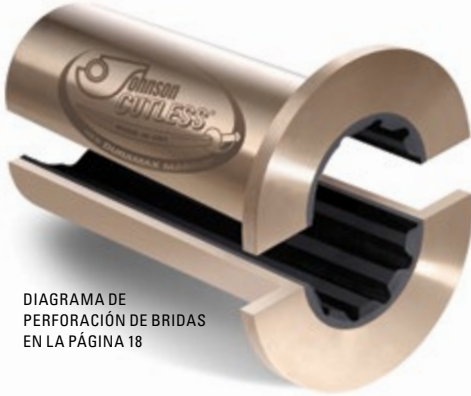
DIAGRAMA DE PERFORACIÓN DE BRIDAS EN LA PÁGINA 18

Los rodamientos bridados Johnson Cutless® están fabricados de latón naval centrifugado con una brida integral para atornillar a un casquillo de bocina o soporte de montaje, lo que permitirá fijar el rodamiento y evitar la rotación una vez en la carcasa. El caucho de nitrilo, especialmente formulado para resistir el aceite y productos químicos, se ha fijado cuidadosamente a la cubierta.