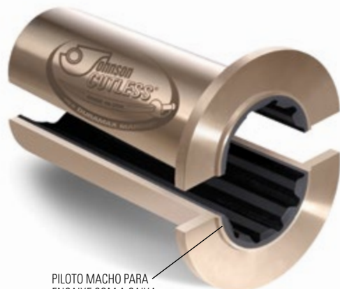
PILOTO MACHO PARA ENCAIXE COM A CAIXA DE GAXETA

Fabricados com a mesma qualidade avançada que os outros rolamentos de latão naval Johnson Cutless®, estes rolamentos flangeados para a instalação do tubo de popa anterior têm um piloto macho projetado para acoplar com o encaixe fêmea no flange da caixa de gaxeta. A caixa de gaxeta tem uma entrada para canalizar a água para lubrificar os rolamentos.